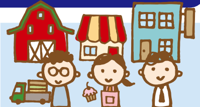
個人商店・法人など