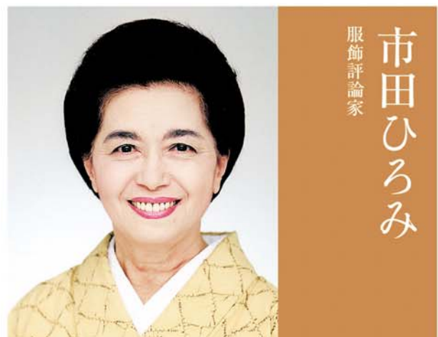
市田ひろみ 服飾評論家

最初のころは、着付け、帯結びという技術が主たるテーマだったが、やがて服飾史にひらき、美術工芸も、私のテリトリーになった。